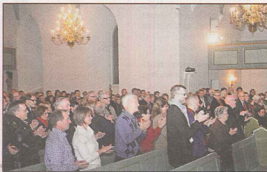
STÅENDE APPLAUS: Publikum var storfornøyd etter konserten.